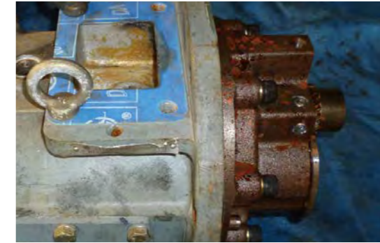
DSP本体に錆びが付着。ロックし緊急停止