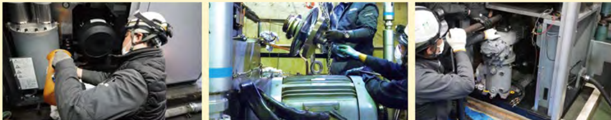
※遠隔監視はKOUDENMENTEプレミアム・ライトのみ対応

遠隔監視は離れた場所でコンプレッサーの状態を把握できます。 PCやタブレットで稼働状況を確認できますので、監視に特別な機器は必要ありません。