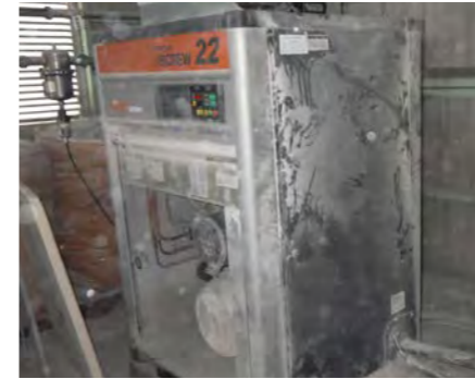
ノーマンテ状態で運転を継続し緊急停止

整備をおこなわないと不意の停止や故障で工場全体の稼働を止めてしまうことも。イレギュラーの復旧費用発生や利益の大きな損失を防ぐ定期整備は必要不可欠です。